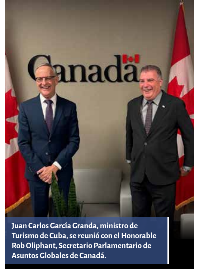
Juan Carlos García Granda, ministro de Turismo de Cuba, se reunió con el Honorable Rob Oliphant, Secretario Parlamentario de Asuntos Globales de Canadá.

Durante un intercambio del titular del Turismo en el archipiélago con las contrapartes canadienses en noviembre pasado en Toronto, elogió a los principales socios operadores turísticos canadienses, incluidos Sunwing, WestJet Vacations y Air Canada Vacations, por su papel crucial en la conexión de las dos naciones.